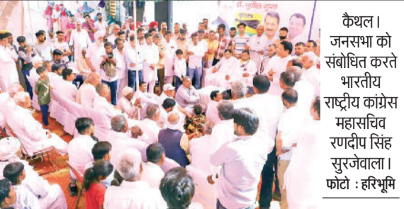
कैथल। जनसभा को संबोधित करते भारतीय राष्ट्रीय कांग्रेस महासचिव रणदीप सिंह सुरजेवाला।