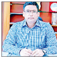
डीसी मोहम्मद इमरान रजा। हरसंभव मदद उपलब्ध करवाई जाएगी।

जिला निर्वाचन अधिकारी मोहम्मद इमरान रजा ने अधिकारियों को निर्देश दिए कि वे आगामी लोकसभा चुनाव के दौरान जिले में अवैध रूप से शराब की बिक्री न हो, इसके लिए संबंधित विभाग तत्परता से निगरानी करें और समय-समय पर अधिकृत शराब ठेकों पर रिकार्ड भी चेक करें। किसी भी हाल में जिले में अवैध शराब ना मिले। अगर कहीं भी अवैध शराब पाई गई तो संबंधित लोगों खिलाफ सख्त से स त कार्रवाई की जाए। सदिग्ध लोगों व स्थानों पर कड़ी नजर रखते हुए जिले में अवैध शराब की सप्लाई को रोकने में सजगता रखनी है। इसके