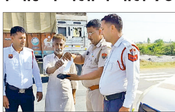
कैथल। वाहनों की जांच करते पुलिस कर्मचारी।